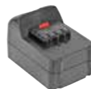
169 020 / 169 021