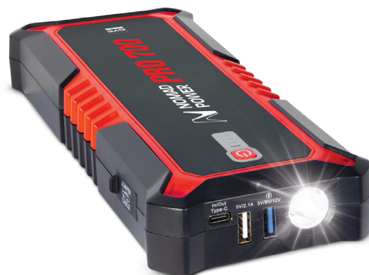
LED di ricarica

Leggero (820 g) e compatto , troverà suo posto nel portaoggetti del veicolo oppure in una valigia.