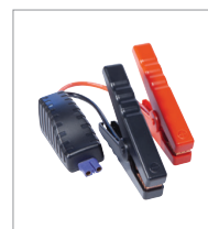
Cavo di avviamento intelligente