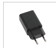
Caricabatterie 230 Vac / 5 Vdc