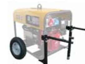
carrello per spostamento manuale (cod. 09061)

N.B. Il quadro ad intervento automatico QIA430 è in armadio separato e completo di commutazione. Quando fornito assieme al generatore il quadro manuale viene eliminato dal generatore.