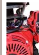
avviamento a chiave