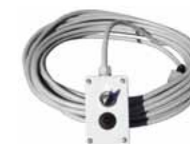
comando a distanza con cavo da 15 mt. compreso (cod. 09099)