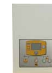
quadro intervento automatico mod. QIA430 (cod. 09071) ulteriori dettagli a pag. 72