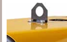
gancio di sollevamento centrale