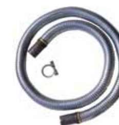
prolunga flessibile gas di scarico lungh. mt. 2 (cod. 09924)