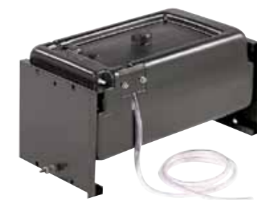
serbatoio da 20 lt. per fissaggio a parete (cod. 09085) (elimina quello di serie a bordo gruppo)