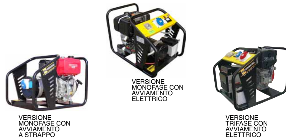
VERSIONE MONOFASE CON AVVIAMENTO A STRAPPO