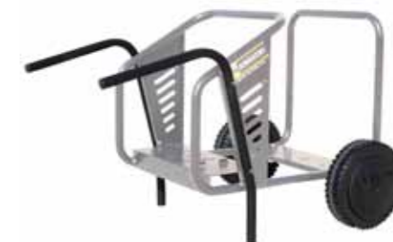
carrello per spostamento manuale (cod. 09060)