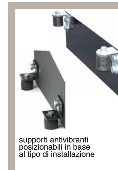
supporti antivibranti posizionabili in base al tipo di installazione