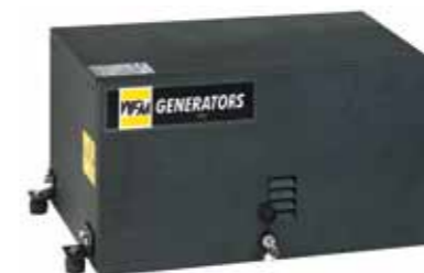
GRUPPO CHIUSO CON SPORTELLO A CHIAVE