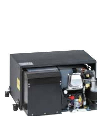
GRUPPO APERTO CON INTERNO SU SLITTA PER UNA FACILE MANUTENZIONE

BENZINA - 3000 giri/min - aria per camper e veicoli commerciali