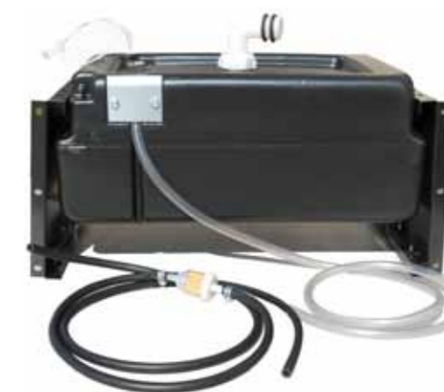
serbatoio da 20 lt. completo di staffe fissaggio, raccordi e rubinetto (cod. 09076)