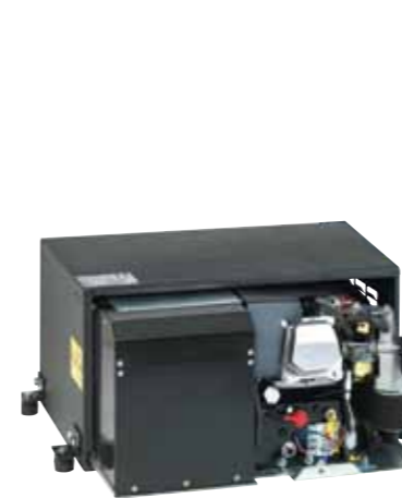
OPEN GEN SET WITH INTERNAL SLIDE FOR EASY MAINTENANCE

GRUPE OUVERT AVEC RAIL INTÉRIEURE POUR FACILITER LA MANUTENTION