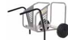
carrello per spostamento manuale C165-MTH (cod. 09060)