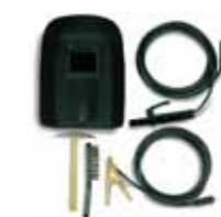
kit per saldatura (cod. 09030)