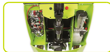
PLATE-FORME DE L'OPERATEUR

Par démontage du capot vous avez accès au système hydraulique et électrique ainsi qu'au moto réducteur et aux roues stabilisatrices.