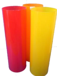
Getöntes Polycarbonat Rohre