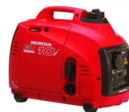
Generator Honda EU10i – 1000 W