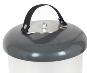
Manico da sospensione