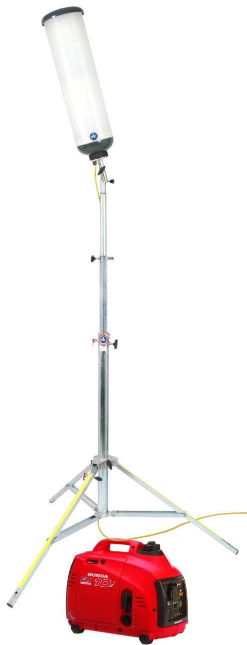
Gruppo elettrogeno Honda EU10i – 1000 W