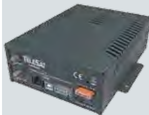
Unità di controllo DVB-S2 HD