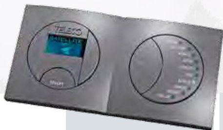
Pannello di comando intelligente orizzontale a parete

Di default sono presenti in memoria i seguenti satelliti: Astra 19, Hot Bird, Astra 23, Eutelsat 9, Eutelsat 5, Hispasat, Astra 28, Astra 4, Thor, Turksat.