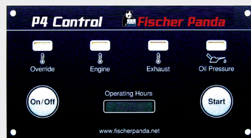
Tableau de commande P4-Control