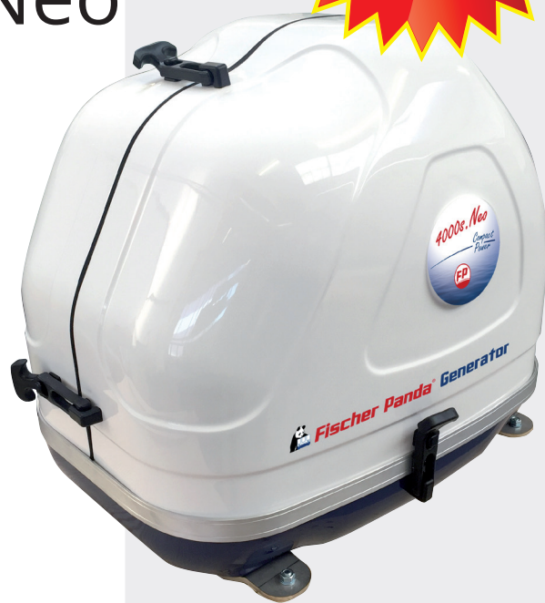
Générateur Panda 4000s.Neo