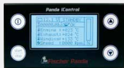
Ecran digital Panda iControl