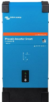
Convertisseur Phoenix Smart 12/2000