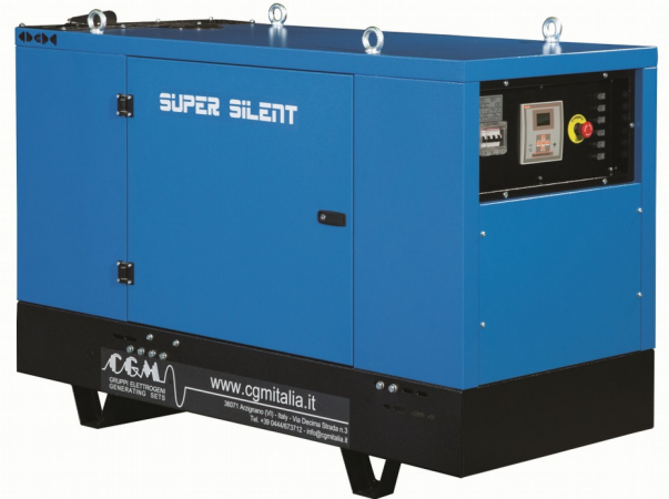
Le immagini sono puramente a titolo dimostrativo The images are only for demonstration purposes Cettes images sont utilisées uniquement à des fins de démonstration