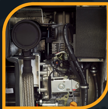
Motore Yanmar 3000 giri/min