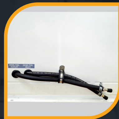
Ingresso e uscita gasolio