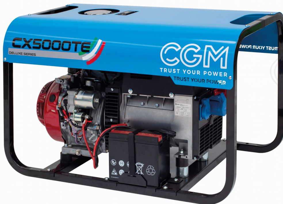
immagine è puramente a titolo dimostrativo The image is only for demonstration purposes Cette image est utilisée uniquement à des fins de démonstration Las imágenes son puramente para fines de demostración Das Bild dient nur zu Demonstrationszwecken

CGM DELUXE-Reihe Benzengeneratoren, 3000U/min, leicht, kompakt und einfach zu bedienen. Es ist auf einem festen Sockel mit Antivibrationsgummis montiert. Diese Generatoren können leicht an eine Vielzahl von Anwendungen angepasst werden, wie z.B. Wohnen, Camping, Hobbys, Baustellen etc. Die 3000 U/min Einheiten sind nur für den Notbetrieb geeignet. Eine kontinuierliche Anwendung von mehr als 6 Stunden und mehr als 500 Stunden pro Jahr wird nicht empfohlen.