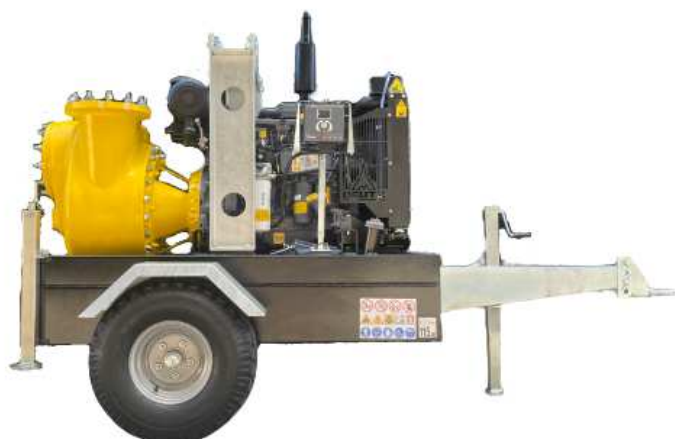
Immagine a scopo illustrativo / Image for illustrative purposes

Motopompe autoadescanti realizzate su telaio con ruote e serbatoio incorporato, piedini di stazionamento, avviamento elettrico con batteria e centralina di protezione motore. Ideale per drenaggio e qualsiasi altra applicazione più impegnativa nei cantieri e nei settori di industria ed emergenza. Il pompaggio di fluidi più abrasivi con elevato passaggio di corpi solidi è garantito dalla robustezza del sistema idraulico e della esclusiva girante, di tipo con pale aperte e doppia curvatura.