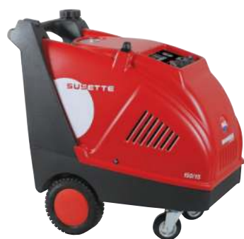
Quadro Elettrico 24 V 24 V Control Panel