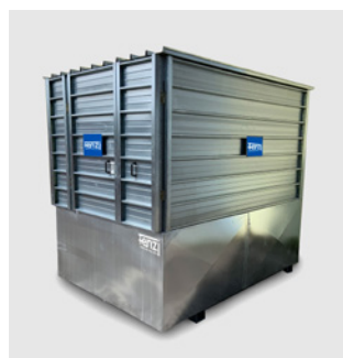
Chiusura totale del distributore Fuel Tank Box