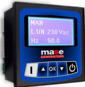
LOGICA DI CONTROLLO