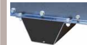
piedi forcabili ed asportabili