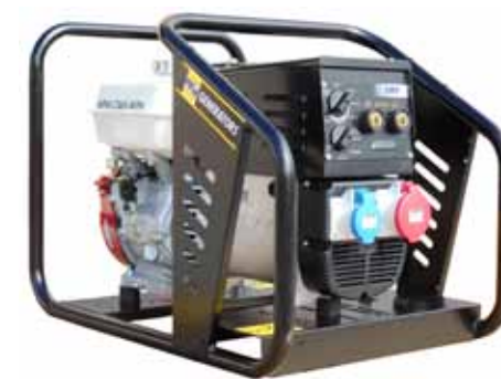
C165-MTH (PETROL - ESSENCE)