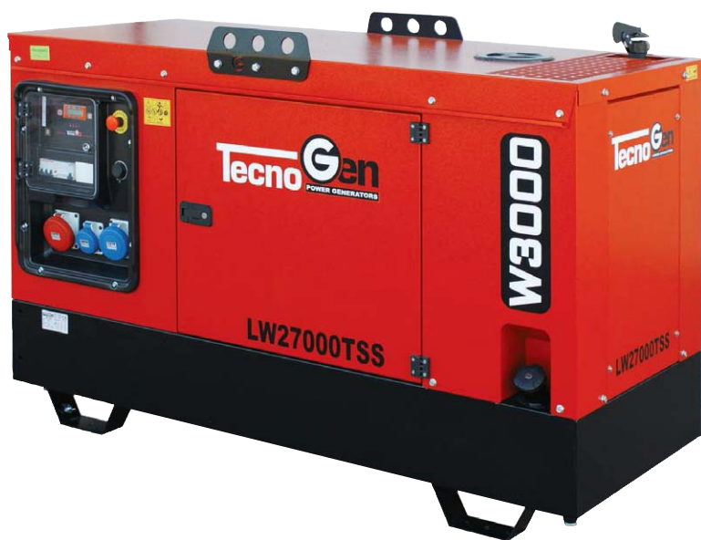
◀ LW 27000 TSS