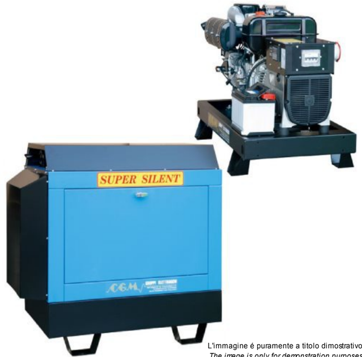
L'immagine è puramente a titolo dimostrativo The image is only for demonstration purposes Cette image est utilisée uniquement à des fins de démonstration