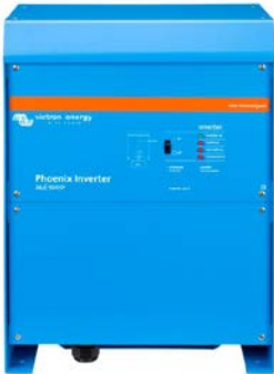
Phoenix Inverter 24/5000