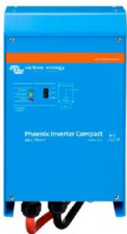
Phoenix Inverter Compact 24/1600

Les possibilités des convertisseurs puissants en parallèle sont réellement surprenantes. Pour en savoir plus sur les batteries, les configurations possibles et des exemples de systèmes complets, veuillez consulter notre livre « Energie Sans Limites » (disponible gratuitement chez Victron Energy et en téléchargement sur www.victronenergy.com ).