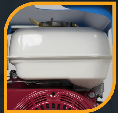
Serbatoio da 3,1 Lt