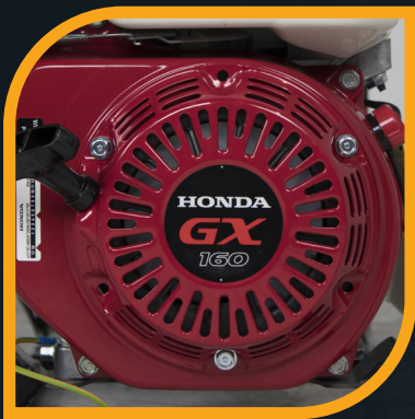
Motore Honda GX 160