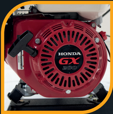
Motore Honda GX 200