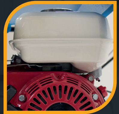
Serbatoio da 3,1 lt