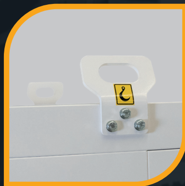
Ganci di sollevamento