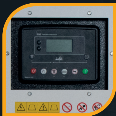
Logica di controllo