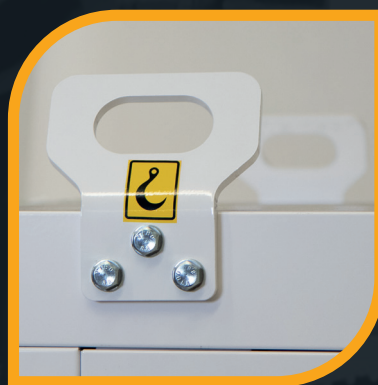
Ganci di sollevamento