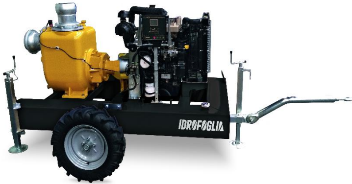
Immagine a scopo illustrativo / Image for illustrative purposes

Pompa autoadescante realizzata per drenaggio e qualsiasi altra applicazione più impegnativa nei cantieri e nei settori di industria ed emergenza. Il pompaggio di fluidi più abrasivi con elevato passaggio di corpi solidi è garantito dalla robustezza del sistema idraulico e della esclusiva girante, di tipo con pale aperte e doppia curvatura.