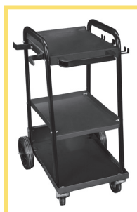
Trolley Optional 99900194